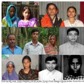
A few supported students with their families