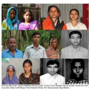
A few supported students with their families